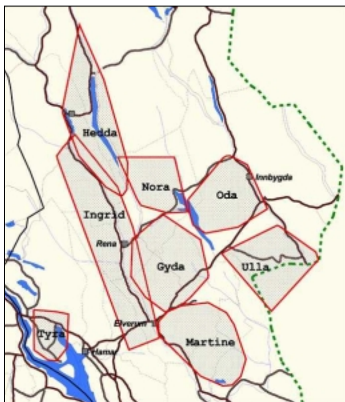
Figur 2. Sosial organisering. Leveområdene til voksne hunngauper i Hedmark.

Til slutt vil vi også nevne betydningen av samarbeide mellom fylker. De enkelte fylker må koordinere observasjoner med nabofylkene for å unngå overtelling av familiegrupper som lever langs grensen. Dette er særlig viktig for små fylker. Jo mindre fylkene er jo større andel av familiegruppene deles med nabofylker.